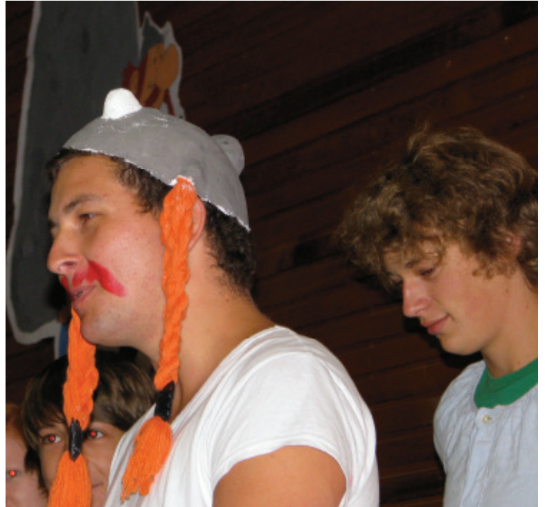
Asterix (links), Obelix (oben) und das Volk am See Genezareth (unten)

Während die beiden suchen, schließen sie sich einer Gruppe auf dem Weg zum See Genezareth an. Dort erleben sie, wie Jesus eine große Menschenmenge satt macht. Die beiden Gallier sind beeindruckt. Aber geht es bei Jesus wirklich nur um Wunder?